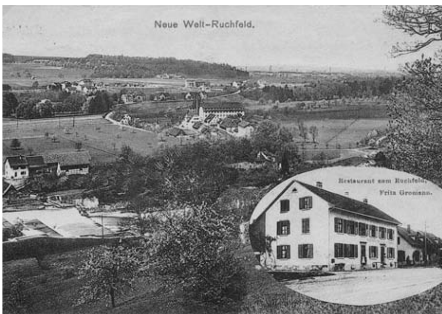
Als die Neuwelt noch weitgehend aus Wiese und Ackerland bestand, stand bereits das Fabrikgebäude, in dem sich die Lächerli ansiedeln sollte.

Der Tipp ist also reichlich verjährt. Dennoch hat die Beschreibung ihren eigenen Reiz: «Die Winterhalde, ist mit Buchen und einigen Eichen angefüllt; sie erstreckt sich bis an den Arlesheimer Bann; bei denen hier anliegenden Steingruben, obenam dem Dorfe, werden zuweilen diejenigen Art Erdschwämme, welche Trüffeln genant werden, ausgegraben.»