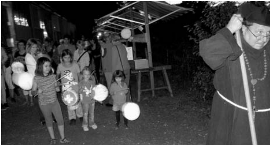
Der Mönch führt den Lampion-Umzug an.