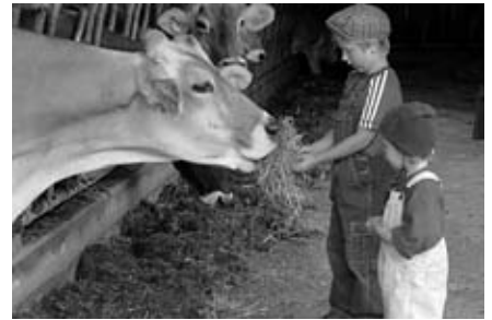
Keine Angst vor grossen Tieren!