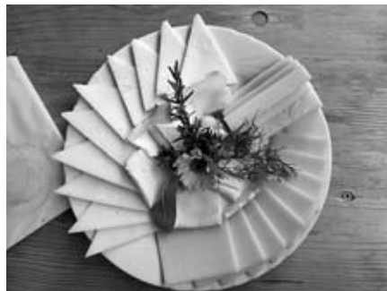
... gab es wunderschöne Käse-Teller.