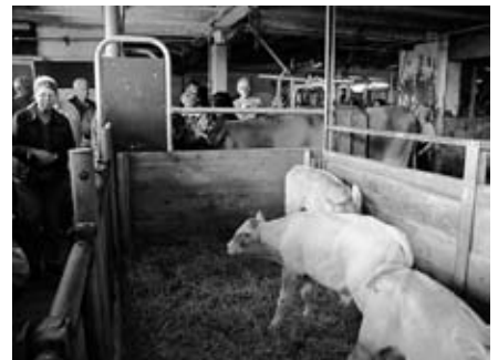
Bei den Kälbchen