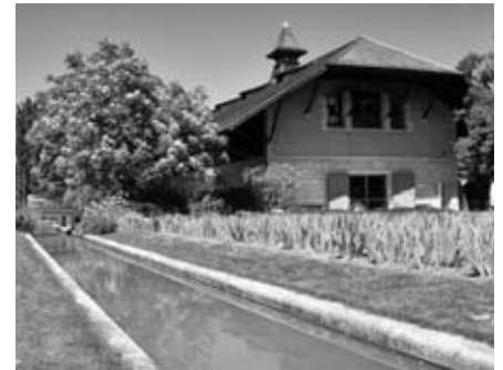
Kutschenmuseum in Brüglingen (eine Aussenstelle des Historischen Museums Basel). Öffnungszeiten: Mi, Sa, So, 14–17 Uhr. Informationen: 061 205 86 00.

Ein Rundgang durchs Kutschenmuseum in Verbindung mit einem Spaziergang durch die Park- und Gartenanlagen des ehemaligen Merianschen Landgutes gibt Einblicke in die Mobilitätsmöglichkeiten vom 18. bis zum 20. Jahrhundert. Luxus-kutschen aus vornehmen Basler Häusern, Postwagen, Geschäftsfuhrwerke, wunderschöne alte Schlitten – eine Augenfreude und interessant auch für Leute, die sich für technische Details interessieren.