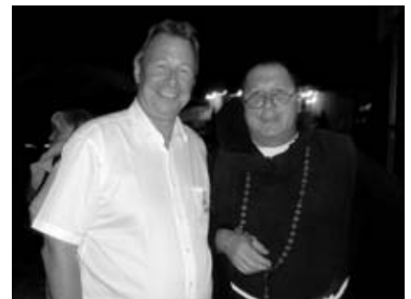
Der Münchensteiner Mönch als «Weibel» des Regierungsratspräsidenten