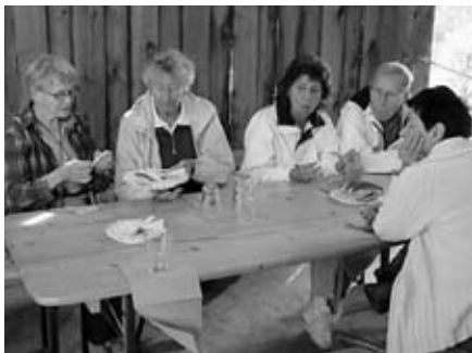
Beim Zvieri ...