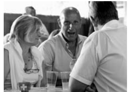
Diskussion am Festhüttentisch