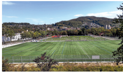
Sport- und Freizeitraum statt Wohnüberbauung: die Münchensteiner Au

Um zukünftig für mehr Einheitlichkeit bei den Baurechtszinsen zu sorgen, soll auf das «Basler Modell» gesetzt werden. Hierbei handelt es sich um ein partnerschaftliches Prinzip, bei dem der Grundeigentümer und der Baurechtsberechtigte